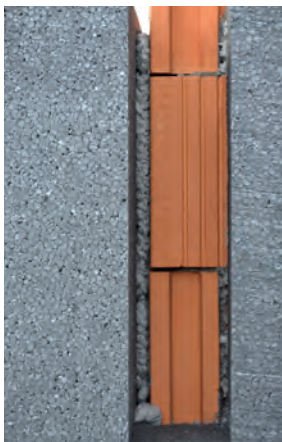
Correggi fino a 30mm di irregolarità

Adatto per polistirene espanso (EPS), polistirene estruso (XPS), pannelli di poliuretano (PUR e PIR), lana minerale e lana di vetro. Può essere applicato su tutti i tipi di materiali comunemente utilizzati, come: calcestruzzo, legno, OSB, membrane bituminose, mattoni, muratura in silicato, vetro, metallo e PVC.