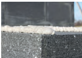
Formula ad alta densità

Tytan Professional Styro PRO è fortemente raccomandato per il montaggio di pannelli isolanti quando si utilizza il sistema ETICS. La sua esclusiva formula ad alta densità assicura presa istantanea, forte adesione e facile livellamento delle lastre.